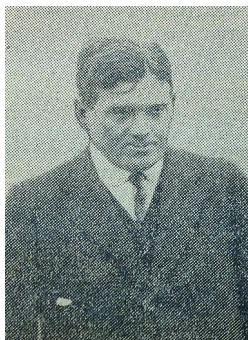
Илл. 7. Летчик Уточкин. Новое время. 1910. 12 сентября