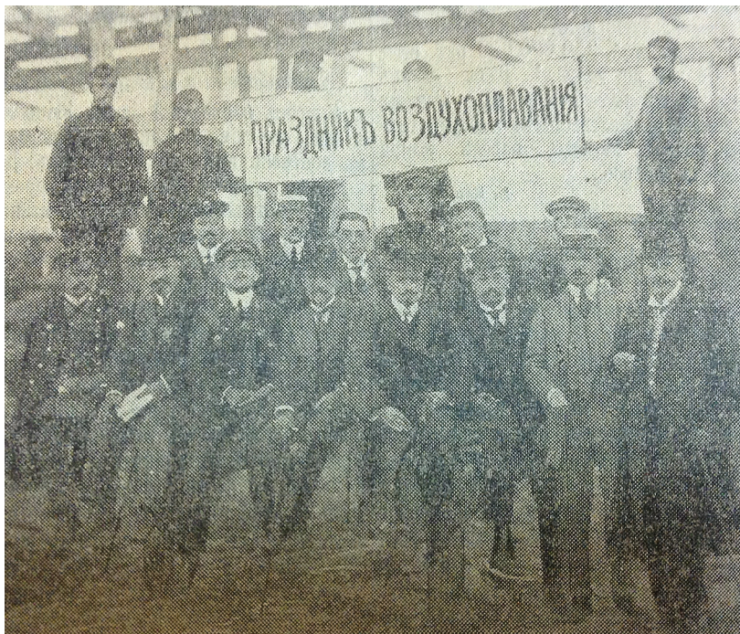
Илл. 4. Организационный комитет праздника воздухоплавания. Новое время. 1910. 8 сентября

Остальные аппараты уже приняты комиссией кап. Мациевича, но еще не прибыли, их всего шесть: три “Блерио”, два “Антуаннет” и один “Теллье”». Также на этом заседании были отобраны шесть человек для обучения авиации в России в особой школе отдела и принято важное решение не прекращать обучение летному делу в зимнее время, используя Севастополь 9 .